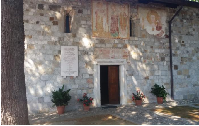
Facciata della chiesa di San Martino parte dell'Hospitale